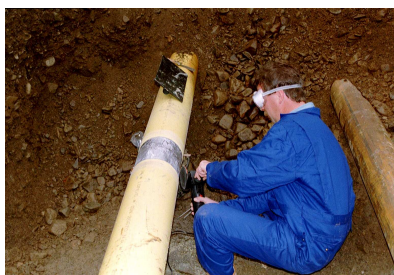
3. Očištění místa svaru od rzi a zdrsnění smirkovým papírem nebo ocelovým kartáčem