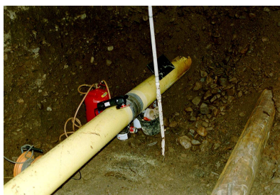
2. Místo svaru