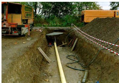
1. Ve výkopu

Pročtěte si také podrobné informace o výrobku a doporučený postup zpracování