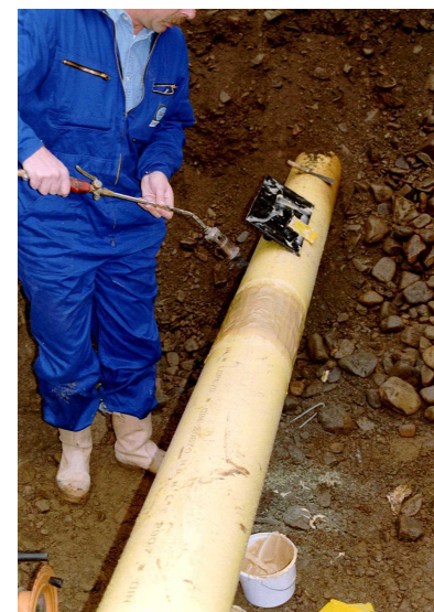
8. Tepelné vytvrzení