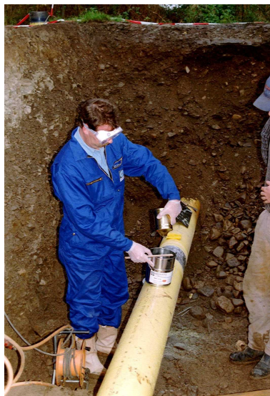
5. Smíchání DENSOLIDU TLC