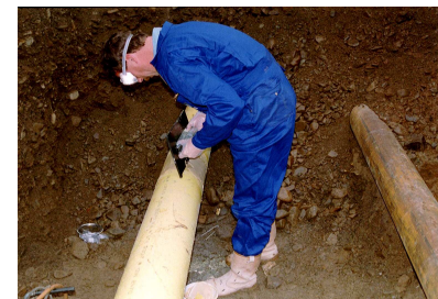
7. Nanesení krycí vrstvy